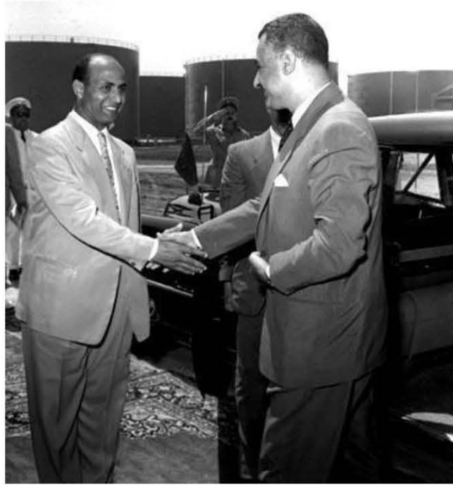
الرئيس جمال عبد الناصر مع محمود يونس أثناء افتتاح خط أنابيب البترول في مسطرد، ١٩٥٦/٧/٢٤.